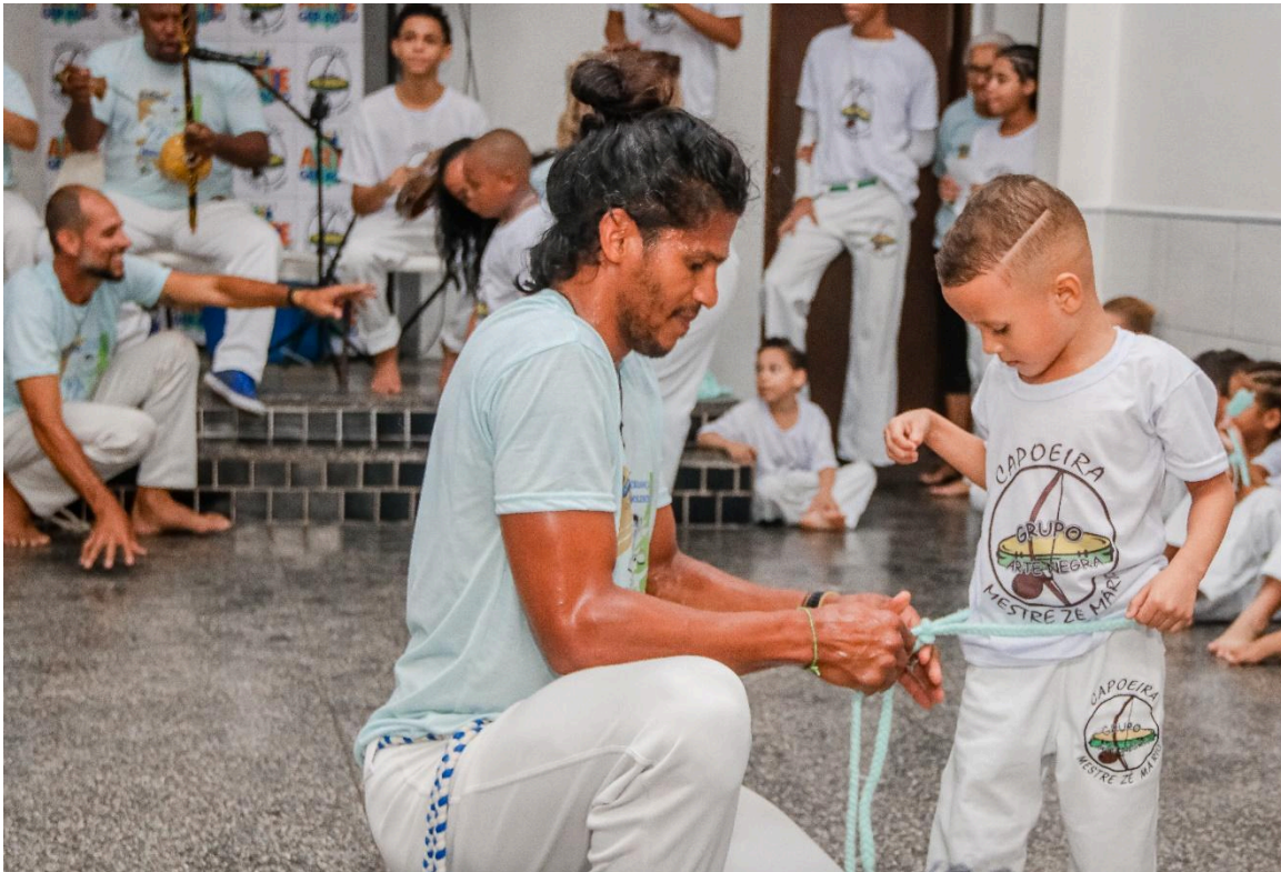
Oficina de confecção de instrumento (Berimbau)