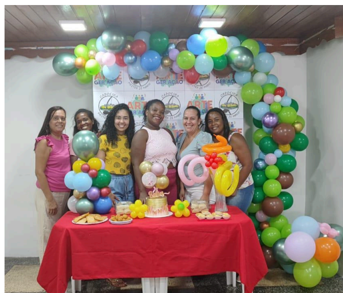
Curso de Formação em parceria com o SESC (Doces e Salgados)