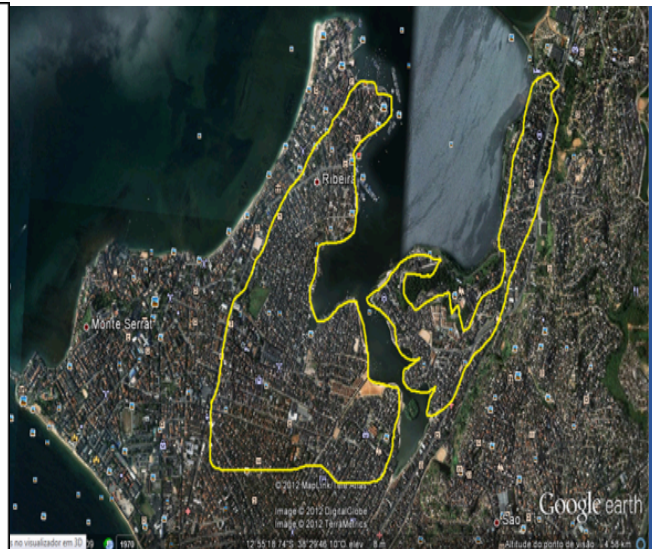
Imagem da Península com demarcação de invasões

A localização da OSC faz parte dos bairros da península de Itapagipe. Surgiu de um processo de invasões de terrenos alagadiços e da luta de seus moradores. De acordo com os dados dos infográficos presentes neste site, em 2010, o bairro Uruguai contava com uma população total de 30.370 habitantes, a maior parte se autodeclarou parda (58,99%) e preta (27,66%), do sexo feminino (53,67%) e se encontrava na faixa etária de 20 a 49 anos (50,99%). A Península de Itapagipe abrange uma área de 697 ha. e uma população superior a 170 mil habitantes, distribuídos por um conjunto de 14 bairros: Uruguai, Ribeira, Bomfim, Monte Serrat, Dendezeiros, Bairro Machado, Alagados, Vila Rui Barbosa, Massaranduba, Baixa do Petróleo, Boa Viagem, Calçada, Mares e Roma.