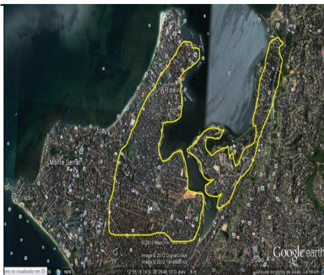
Imagem da Península com demarcação de invasões

A localização da ONG faz parte dos bairros da península de Itapagipe. Surgiu de um processo de invasões de terrenos alagadiços e da luta de seus moradores. De acordo com os dados dos infográficos presentes neste site, em 2010, o bairro Uruguai contava com uma população total de 30.370 habitantes, a maior parte se autodeclarou parda (58,99%) e preta (27,66%), do sexo feminino (53,67%) e se encontrava na faixa etária de 20 a 49 anos (50,99%). A Península de Itapagipe abrange uma área de 697 ha. e uma população superior a 170 mil habitantes, distribuídos por um conjunto de 14 bairros: Uruguai, Ribeira, Bomfim, Monte Serrat, Dendezeiros, Bairro Machado, Alagados, Vila Rui Barbosa, Massaranduba, Baixa do Petróleo, Boa Viagem, Calçada, Mares e Roma.